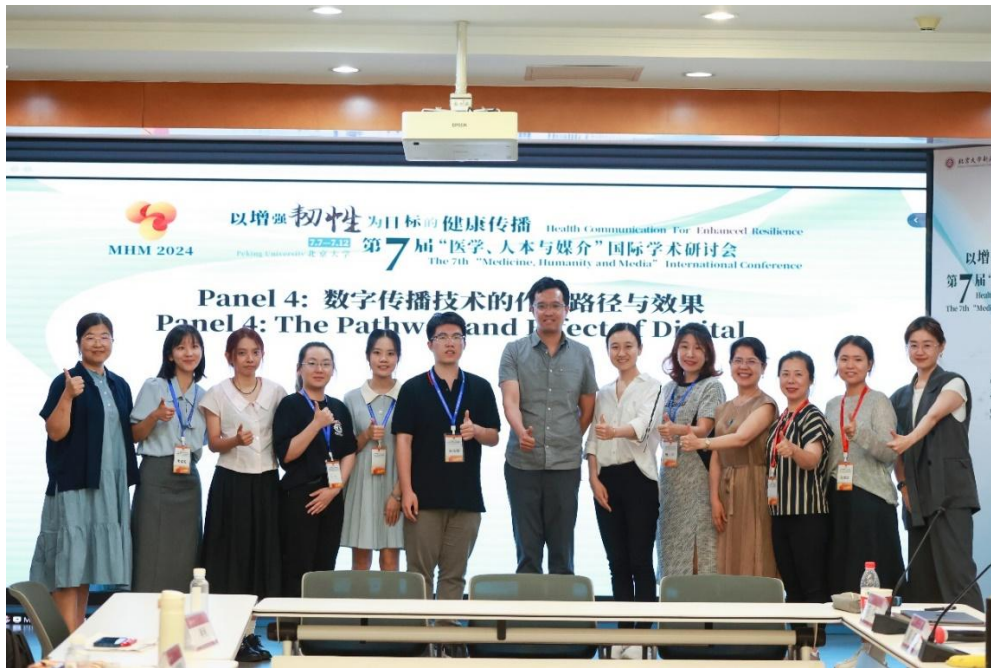
点评人与作者合影

社会学的视角探讨了这一行为的内外在驱动力。通过探讨非自杀性自伤行为的具体发生过程及其动力机制，为理解和预防这一行为提供了新的研究视角。周硕对此研究给予了积极评价，认为探讨身体在自伤行为中的作用有助于更好地理解自伤者的行为动机，实现更有效的干预，建议未来可以增加与身体相关的理论，以丰富研究的深度和广度。